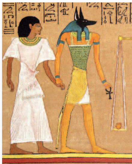
ANUBIS, DIEU CYNOCÉPHALE ÉGYPTIEN ET GUIDE DANS L'AU-DELÀ.

Le chien est aussi le pisteur par excellence, celui qui montre la voie au sens propre comme au sens figuré.