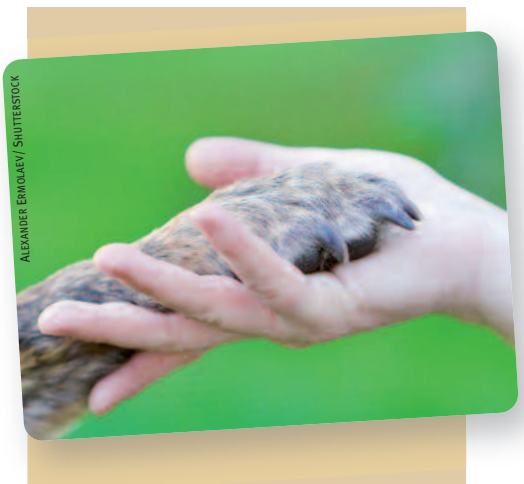
ALEXANDER ERMOLOEV / SHUTTERSTOCK

besoin de vous ! Il faut largement diffuser la pétition via les différents réseaux sociaux et les autres associations concernées par cette problématique... Vous la trouverez en ligne, sur notre site, mais vous pouvez aussi la commander (voir encart central). En parallèle, nous diffuserons un nouveau guide dans la série « Rencontre avec les peuples animaux » : Le peuple chien . Il permettra de mieux faire connaître les chiens, en particulier du point de vue de leur vie mentale et émotionnelle.