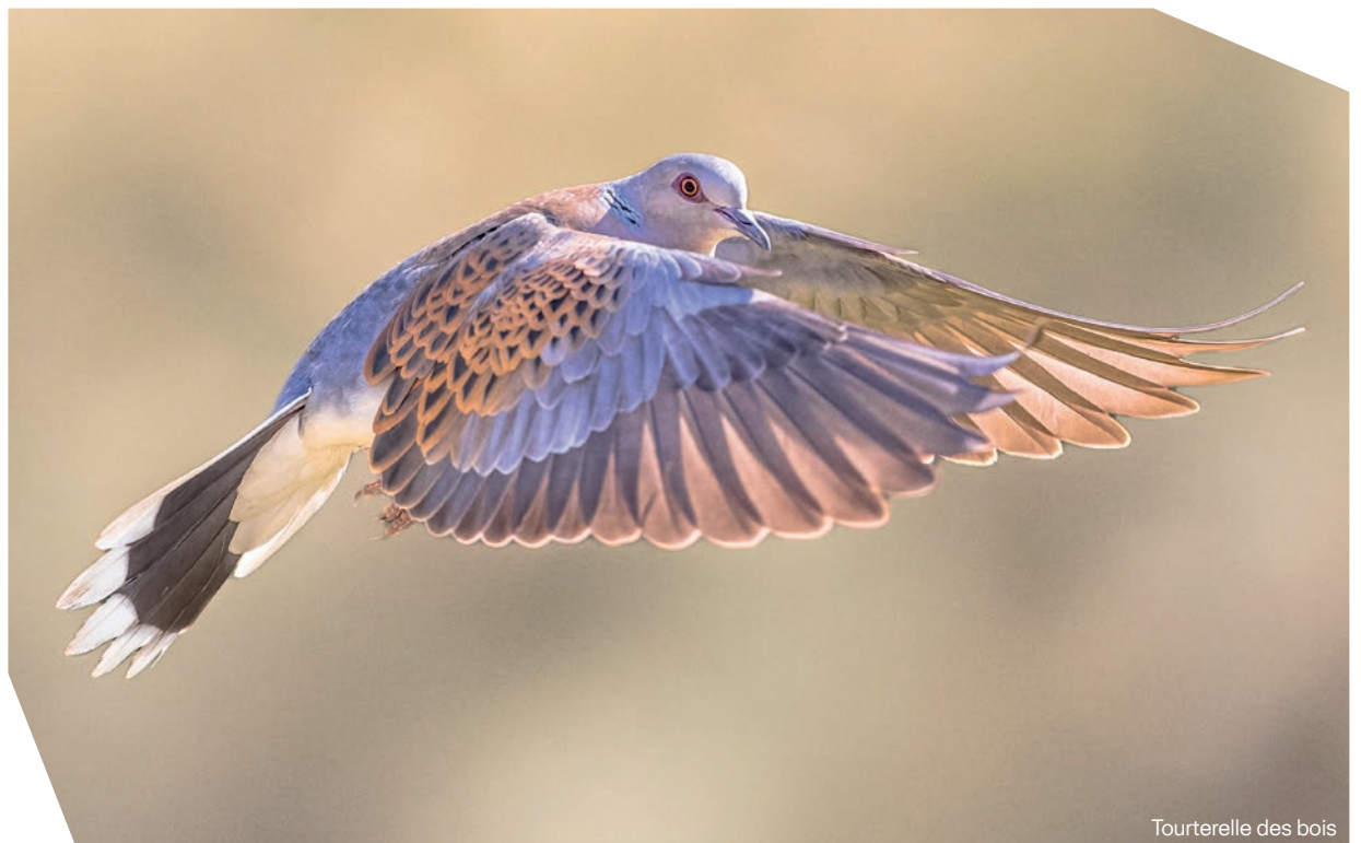
Tourterelle des bois

C'est la même logique scandaleuse qui frappe les tourterelles des bois. Ces voyageuses au plumage délicatement tacheté sont des rescapées : elles ont perdu 80 % de leurs effectifs entre 1980 et 2015 en Europe. En 2020, au terme d'un combat juridique acharné, nous avons obtenu la suspension de leur chasse grâce à un recours devant le Conseil d'État. Cette victoire majeure a porté ses fruits : depuis que les armes se sont tues, les comptages ont montré une légère hausse de leur population le long de la route migratoire occidentale passant par la France. Pourtant, en août dernier, nos dirigeants ont décidé de