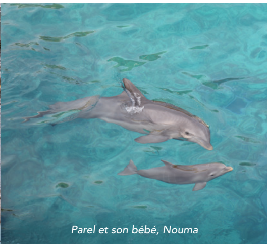
Parel et son bébé, Nouma

À la surface des bassins, exposés aux UV nocifs pour leurs yeux et leur peau, les cétacés sont contraints d'obéir par la privation de nourriture. Ils ne mangeront plus sans contrepartie.