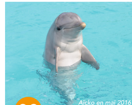
Aicko en mai 2016

Au Japon, One Voice a révélé que lors du massacre annuel des dauphins à Taiji les delphinariums viennent acheter des animaux.