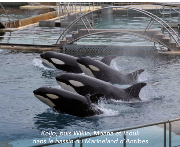
Keijo, puis Wikie, Moana et Inouk dans le bassin du Marineland d'Antibes

Il est temps que le statut de personne animale leur soit accordé en France et en Europe, comme c'est le cas en Inde depuis 2013.