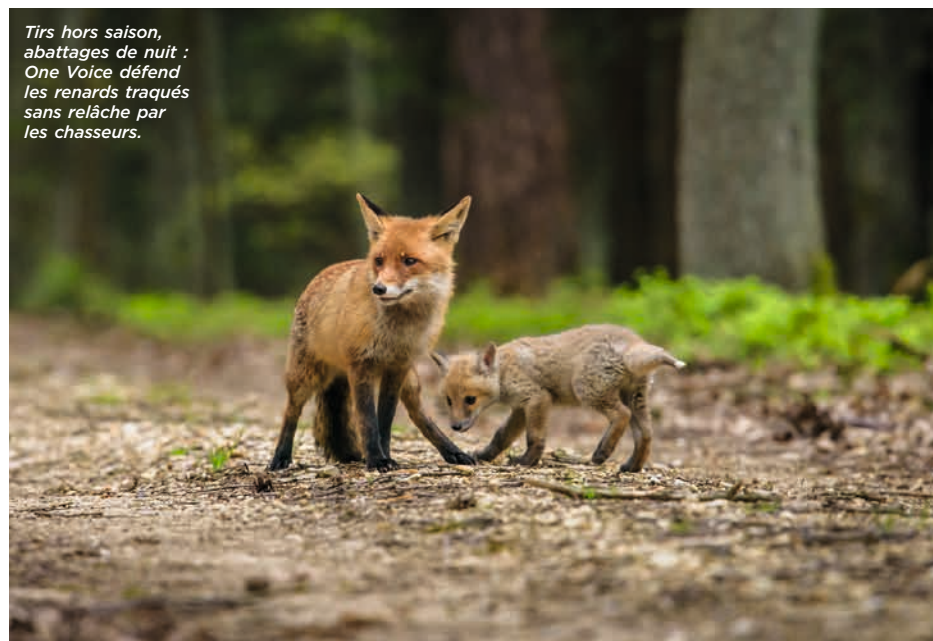
Tirs hors saison, abattages de nuit : One Voice défend les renards traqués sans relâche par les chasseurs.

Indignés, nous avons plaidé la cause de ces petits canidés fin novembre 2018, au tribunal de Nancy. Verdict : l'arrêté sur les tirs de nuit a été suspendu ! Pour la première fois, One Voice réussissait à casser une décision avant que l'irréparable ne soit totalement commis et notre intervention a sauvé la vie de 400 renards. Seconde victoire en janvier 2019, à Strasbourg : encore une fois, le tribunal nous donnait raison ! Pour les renards, plus de chasse après la fermeture officielle, car rien ne la justifiait... ●