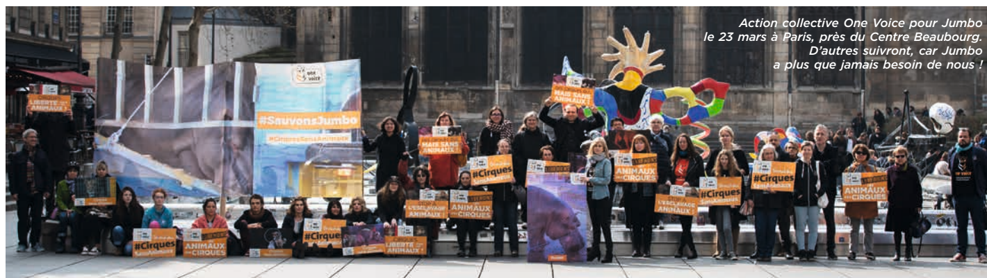
Action collective One Voice pour Jumbo le 23 mars à Paris, près du Centre Beaubourg. D'autres suivront, car Jumbo a plus que jamais besoin de nous !