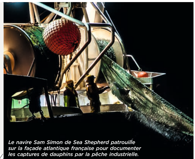
Le navire Sam Simon de Sea Shepherd patrouille sur la façade atlantique française pour documenter les captures de dauphins par la pêche industrielle.

One Voice s'engage avec Sea Shepherd France dans l'opération « Dolphin Bycatch » pour faire la lumière sur ce drame silencieux et rappeler l'État à sa mission de protection de la biodiversité marine !