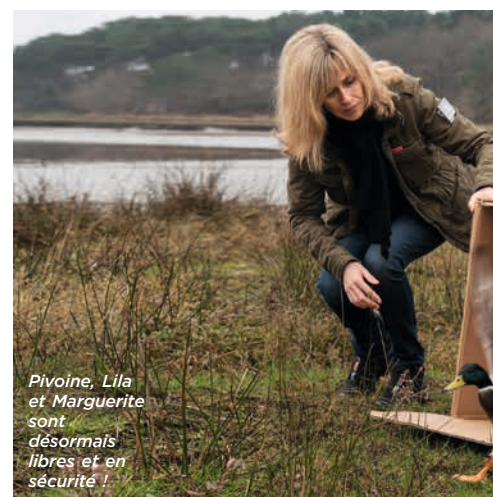
Pivoine, Lila et Marguerite sont désormais libres et en sécurité !

Nous avons porté plainte auprès de la gendarmerie, qui a vite classé sans suite l'affaire, mais nous a autorisés à récupérer les quatre malheureux !