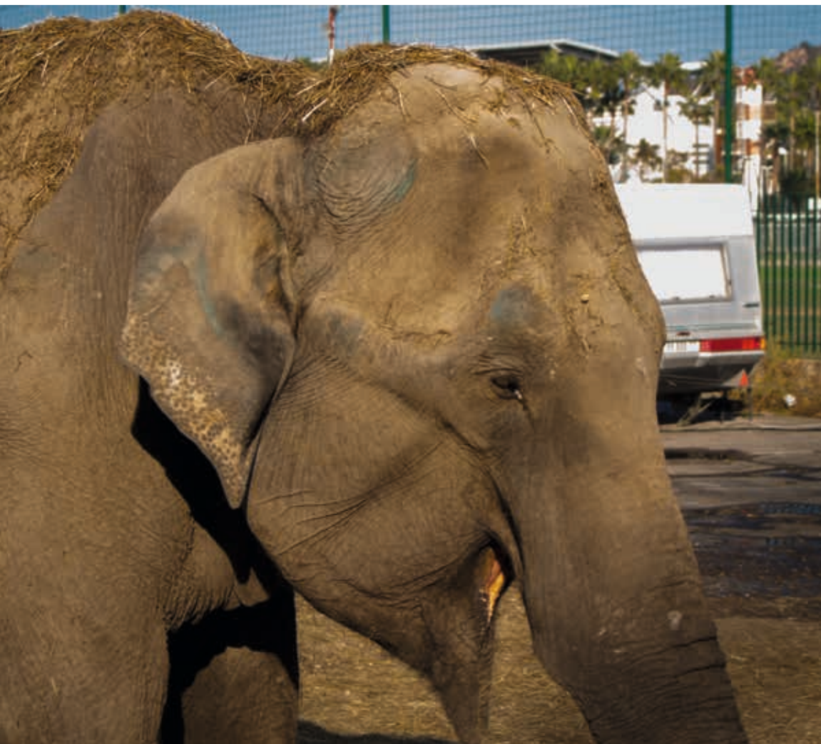
Maya, bientôt à la retraite !