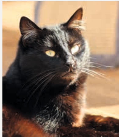
Azalée attend une famille depuis 2012.

« L'année 2017 a été catastrophique. Certaines fourrières qui n'euthanasiaient pas ont dû s'y résoudre et moi-même j'ai été forcée d'endormir 13 chatons qui n'avaient pas encore les yeux ouverts. On ne trouve pas de familles d'accueil, les gens ne se mobilisent pas ». Les responsables contactés font néanmoins preuve de courage et de détermination : « Si on lâche c'est foutu, il ne faut pas baisser les bras, mais c'est compliqué... »