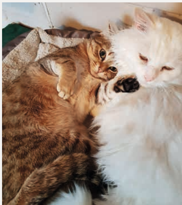
Abyss et Blanco, inséparables, ont été sauvés par One Voice en 2017 mais peinent à trouver une famille pour la vie...

Les pics d'afflux de chatons sont aussi problématiques : les soins aux juvéniles ont un coût très lourd pour les associations, et ils sont souvent préférés à l'adoption, laissant sur le carreau les chats adultes déjà recueillis... « La population continue d'augmenter car les gens ne sont pas responsables : ils ne font pas stériliser leurs chats », souligne la responsable d'un refuge normand. Or la cote d'alerte est atteinte (voir encadré ci-contre).