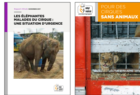
Nos derniers rapports d'étude et dépliant sur le cirque sont à lire et télécharger sur le site one-voice.fr ou à commander par téléphone ou courrier.