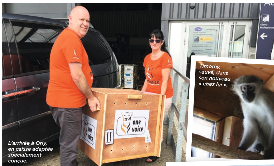
L'arrivée à Orly, en caisse adaptée spécialement conçue.