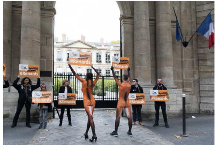
En mode campagne : à Paris, malgré le froid du 8 novembre, One Voice était en action, devant le Ministère, pour porter la cause des renards.

Nous évoquerons une récente décision du Tribunal administratif de Strasbourg, qui vient d'annuler et déclarer illégal un arrêté préfectoral pris en 2016 à la demande des chasseurs, autorisant sur 170 communes les tirs de nuit de renards. Le juge a en effet douté qu'abattre encore plus d'animaux puisse contribuer à éradiquer de possibles contaminations parasitaires (c'est tout le contraire, voir Noé #88 ), ni contribuer à préserver les lièvres, perdrix, faisans, que les chasseurs souhaitent garder pour eux. Rappelons que plus de 10 000 renards, déjà