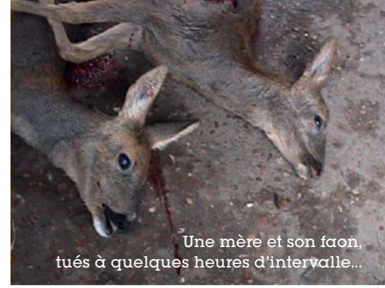
Une mère et son faon, tués à quelques heures d'intervalle...

Les chasses violent le droit à la propriété privée où les animaux se réfugient. Si une autorisation doit être demandée au préalable au propriétaire, c'est loin d'être toujours la réalité. L'argument que l'animal est mortellement blessé prévaut et permet de contourner la loi. On a même vu des chasses au cerf se terminer dans un village, un parking de supermarché aux heures d'affluence, et dans le salon